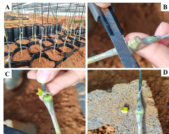
A. 芽接移栽后的籽苗; B. 从叶柄基部划开芽接缝; C. 脱下叶柄; D. 使用芽接膜盖好叶痕。

脱叶柄的芽接成活率比较:,从上述 3 人中选其中 1 人,以热研 879 的带叶柄叶芽进行籽苗芽接,在芽接移栽后 7 ~ 16 d,每天 1 个处理进行脱叶柄操作,共 10 个处理,每个处理操作 72 株,设 3 次重复,每个处理脱完叶柄 30 d 后调查成活率。试验三:不同品种脱叶柄的芽接成活率比较,对云研 7346、热垦 628、热研 879 带叶柄叶芽籽苗芽接苗作脱叶柄处理,以不脱叶柄处理作对照。脱叶柄处理:在芽接移栽后第 10 ~ 14 d 每天巡视一遍,将已变黄的叶柄脱下。每个品种操作 150 株,设 3 次重复,脱完叶柄 30 d 后调查成活率。不脱叶柄的处理在移栽 45 d 后调查成活率。试验四:不同类型芽片芽接成活率比较,以 PR107 的鳞片芽、脱叶柄叶芽和带叶柄叶芽进行籽苗芽接,每种芽片芽接至少 72 株,设 3 次重复。带叶柄叶芽芽接的苗木,在移栽后第 10 ~ 14 d 每天巡视一遍,将已变黄的叶柄脱下,脱完叶柄 30 d 后调查成活率;鳞片芽和脱叶柄叶芽芽接的苗木,在移栽 45 d 后调查成活率。